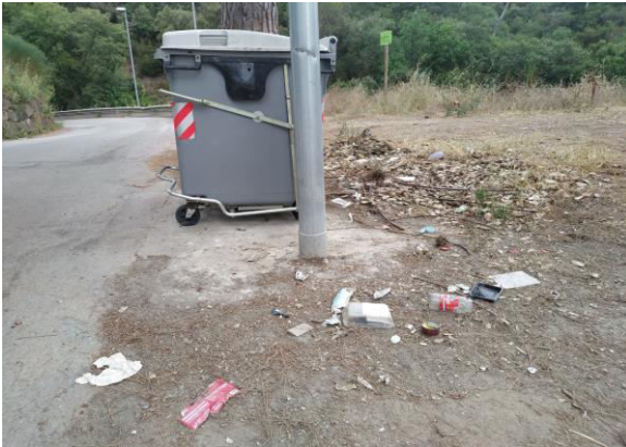
Camí de la Reineta, 15 (Foto 1)