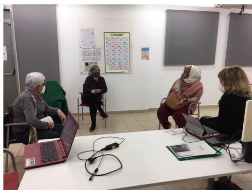
Sessió Grup de dones del Pla Comunitari (27/01/2021)