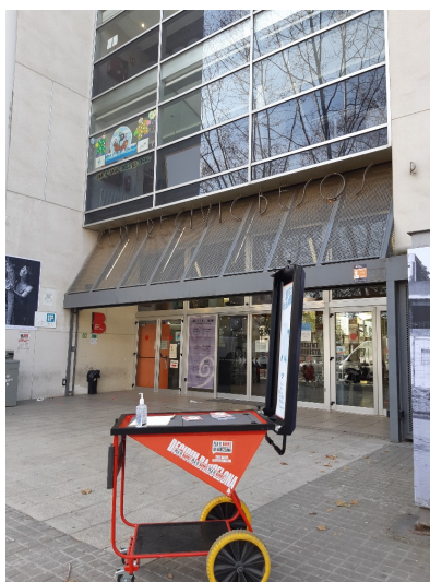
Imatge del Punt Mòbil al Centre Cívic Besòs