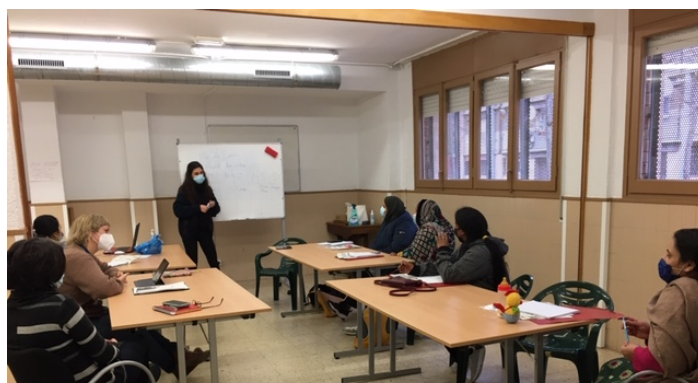
Sessió Grup de dones paquistaneses (26/01/2021)