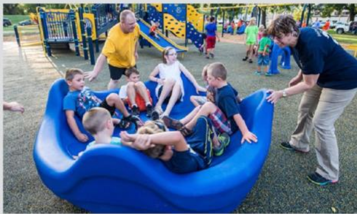
Carrusels i Balanci