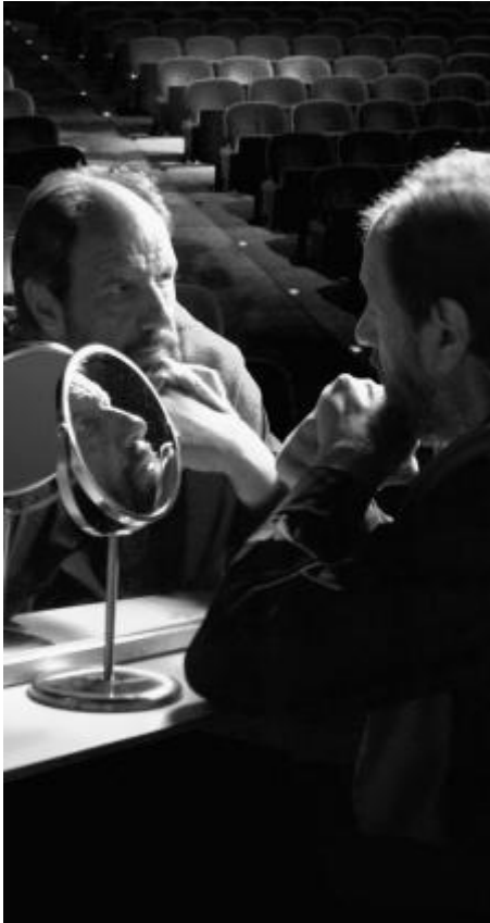
Màscares , d'Elisabet Cabeza i Esteve Riambau