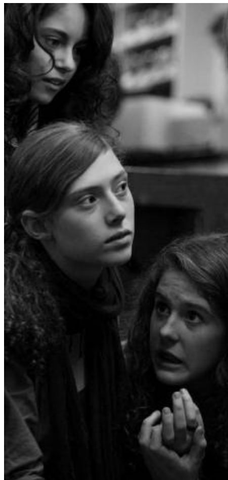
Blog, d'Elena Trapé

No hi ha cap dubte de que el cinema català -un cinema que trenca esquemes, que busca formes noves de expressió o com parlar del món des de la primera persona- és una realitat inqüestionable. Aquí i fora de les nostres fronteres.