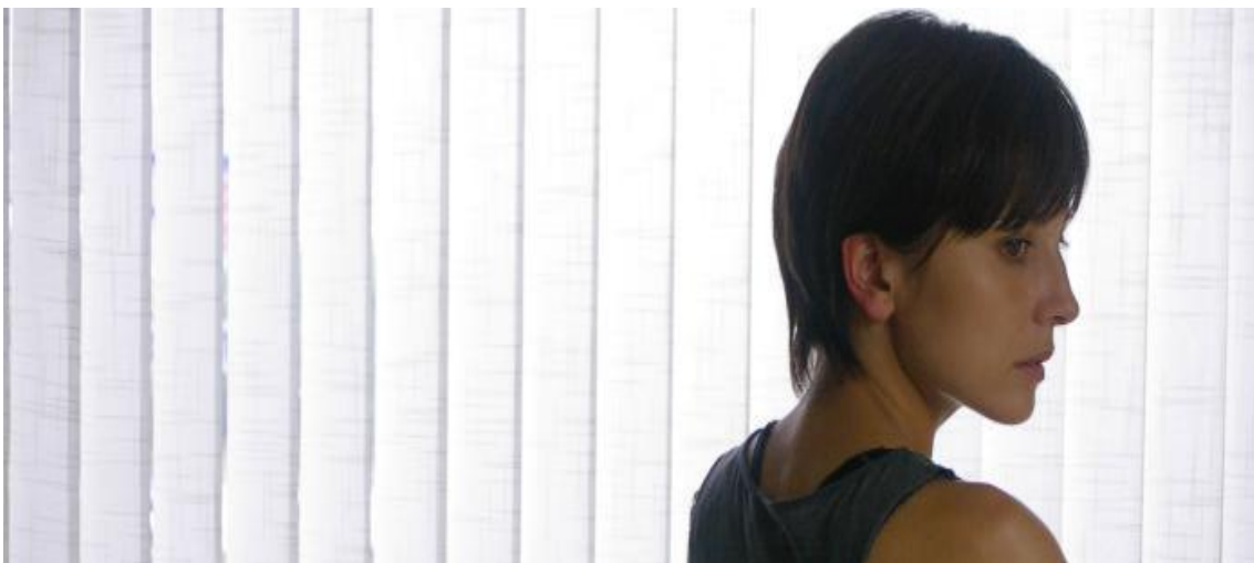
Lo mejor de mí , de Roser Aguilar