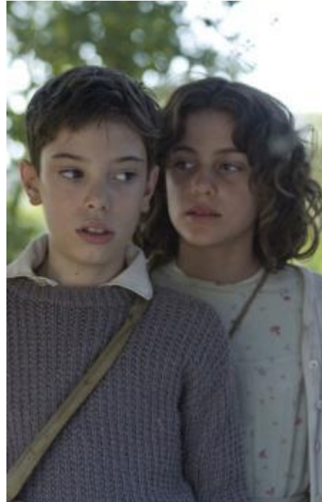
Pa negre , d'Agustí Villaronga