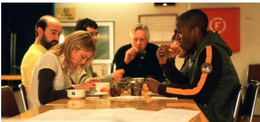
La vida secreta de las palabras

Fructuós Gelabert i Segundo de Chomón , que van dirigir pel·lícules al començament del segle XX, són la base sobre la qual s'ha construït el cinema català i espanyol al llarg de més de cent anys. Fructuós Gelabert va dissenyar els primers estudis de rodatge d'Espanya i, amb una mirada realista, va rodar la primera pel·lícula de ficció del país, Riña en un café (1897); Segundo de Chomón, amb una mirada fantàstica, imaginativa i sobretot, experimental, va rodar el 1905 el que seria el seu film més cèlebre, El hotel eléctrico , confirmada avui dia com la primera pel·lícula que va emprar el recurs de l'animació, fotograma a fotograma, abans que cap altra a la història del cinema.