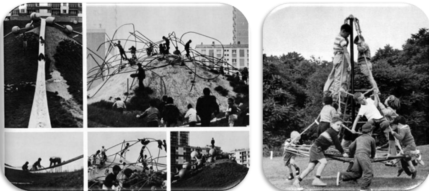
Imatges del llibre de Marguerite Rouard & Jacques Simon, Espaces de jeux : de la boîte à sable au terrain d'aventure (1976)

POSSIBLES ACCIONS: saltar cap amunt; caminar amb oscil·lacions verticals; enfilar-se; grimpar; col·locar-se en posició elevada per observar atentament; etc.