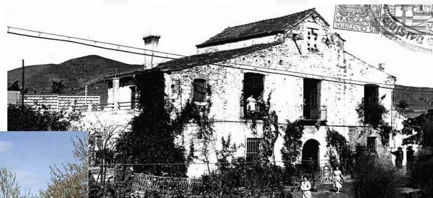
Rehabilitació de Can Valent