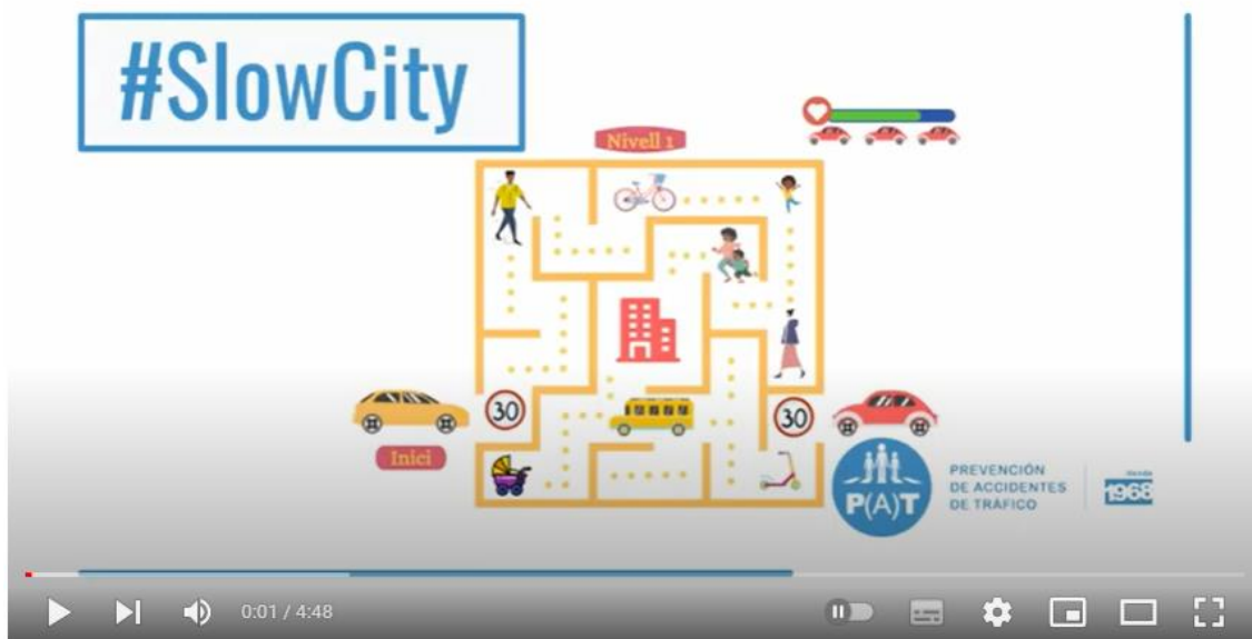
#SlowCity - Projecte de P(A)T amb la Universitat Autònoma de Barcelona

A continuació, el vídeo guanyador . https://youtu.be/9ygli6ucsYY