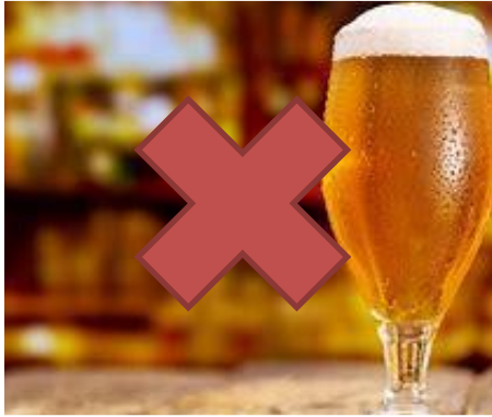
Alcohol i drogues