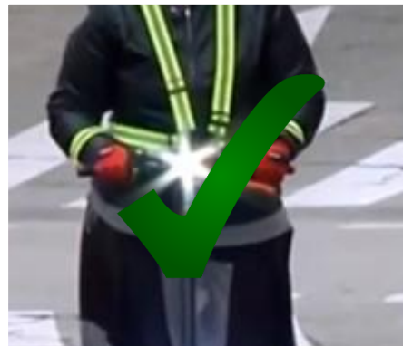
Reflectants i llums