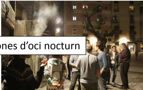
Zones d'oci nocturn