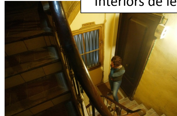
Interiors de les escales