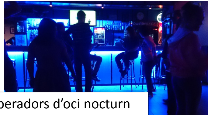
Operadors d'oci nocturn