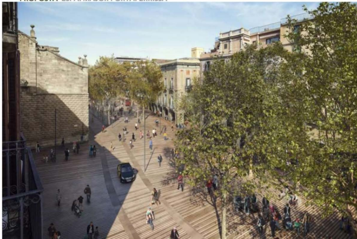
PROPOSTA ESPAI MAJOR PORTAFERRISSA