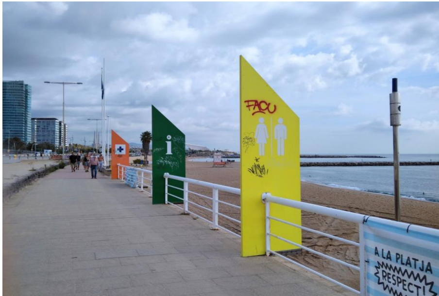
Figura 8. Senyalització de la zona de serveis de la Platja de Llevant.

Estratègia urbana : Serveis Temes tractats : Serveis bàsics Senyalització i orientació