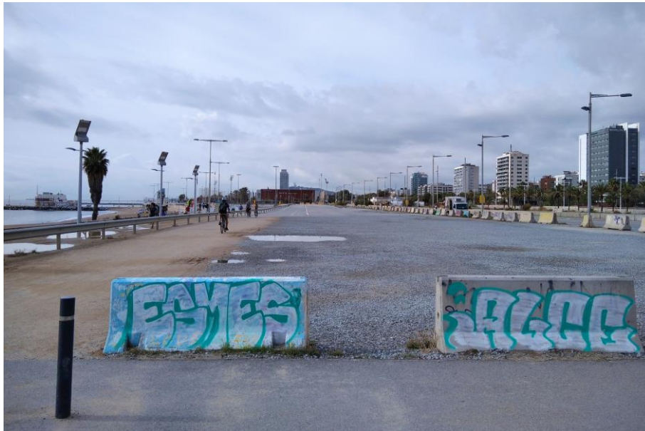
Figura 9. Quarta parada al Passeig Marítim de La Mar Bella.

Temes tractats : Usos quotidians i de cura Joc a l'aire lliure