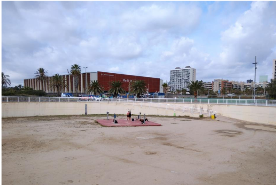
Figura 7. Zona esportiva a l'accés a la Platja de Llevant.

Respecte a l' espai soterrat circular , es comenta que és utilitzat per les persones per prendre el sol i fer exercici amb les màquines. El debat se centra al voltant del tipus d'intervenció necessària per als accessos a la Platja de Llevant. Es consensua la necessitat de garantir l'accessibilitat i el manteniment en aquests espais, però no s'arriba a un consens respecte al tipus d'intervenció. A continuació s'exposen els diferents posicionaments: