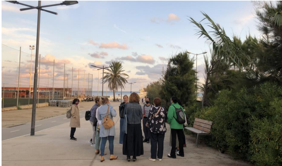
Figura 4. Primera parada a la Porta Bac de Roda.

En relació amb la convivència de mobilitats , es comparteix com una preocupació general la necessitat de saber quins són els espais reservats pels diferents tipus de mobilitats, per garantir la percepció de seguretat . Es considera que les Portes del Passeig Marítim de La Mar Bella podrien ser una zona de conflicte sobretot per les persones que van a peu i en cadira de rodes. S'està d'acord amb la proposta de segregar la zona de vianants a primera línia de mar i la zona de bicicletes a l'interior . Així mateix, es considera important preveure un espai de seguretat als costats del carril bici , de manera que els vianants puguin veure si passa alguna bicicleta abans de seguir el seu recorregut.