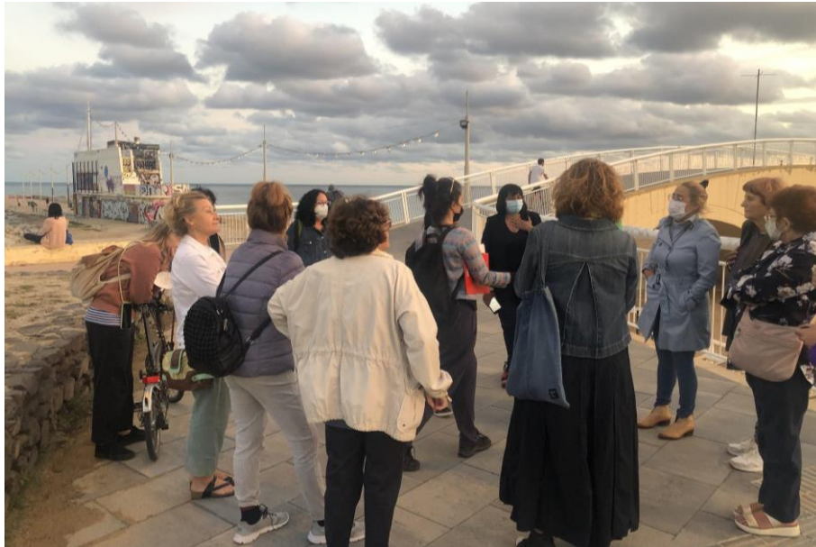
Figura 5. Segona parada a l'accés a la Platja de Llevant.

Temes tractats : Percepció d'(in)seguretat Esport i activitats físiques