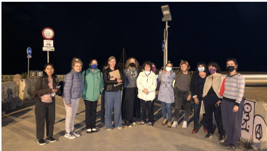
Figura 2. Foto de grup de les participants.