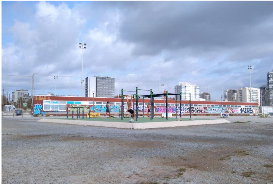
Figura 6. Zona esportiva a cota del Rere platja.

En relació amb l' esport i activitats físiques , es proposa tenir espais lúdics per fer activitats físiques a l'aire lliure , sense interferir el passeig del Rere platja. Es considera important tenir en compte la dinàmica estacional (estiu / hivern) del Passeig Marítim de La Mar Bella a l'hora de proposar elements esportius. Al respecte, s'imagina comptar amb elements esportius per jugar bàsquet, jugar vòlei, fer cal·listènia, fer spinning (bicicletes estàtiques) i altres elements fixos que permetin fer esport de manera autònoma, amb ombra i il·luminació.