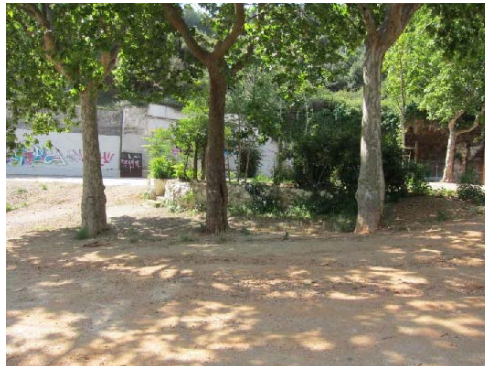
Espai lliure (zona picnic)