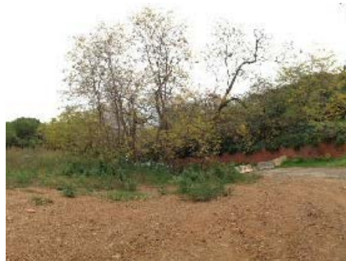
Espai lliure (zona d'esbarjo)