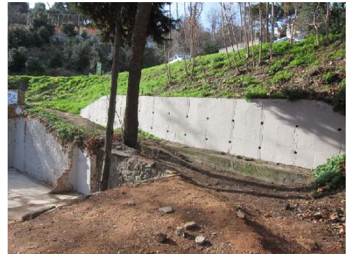
Camí de pujada al C. Maurici Vilomara