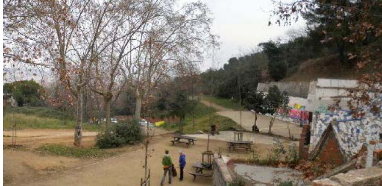
Vista de la plaça