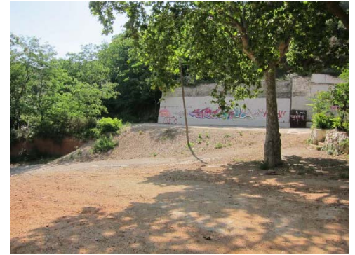
Espai lliure (zona picnic)