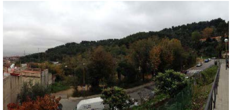
Vista des del C. Penyal