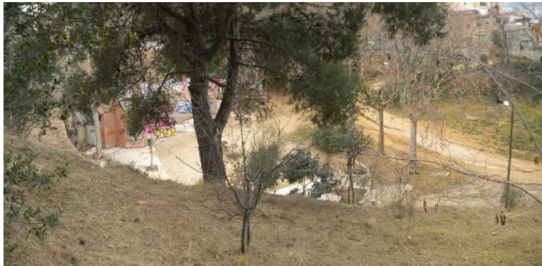
Vista des del Camí Maurici Vilomara