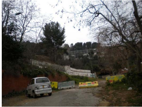
Accés a la plaça pel Pg. de la Font d'en Fargues