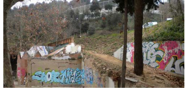
Camí cap al C. Maurici Vilomara