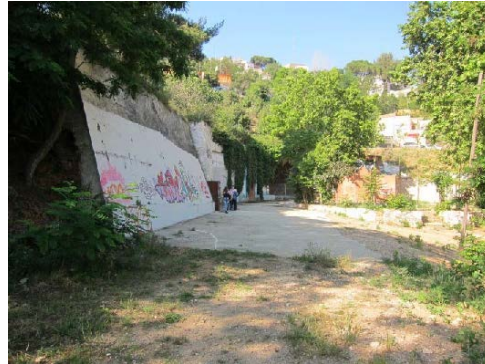
Espai lliure (zona mirador)