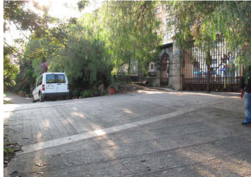
Paviment d'accés al jardí des de l'Av. Mare de Déu de Montserrat