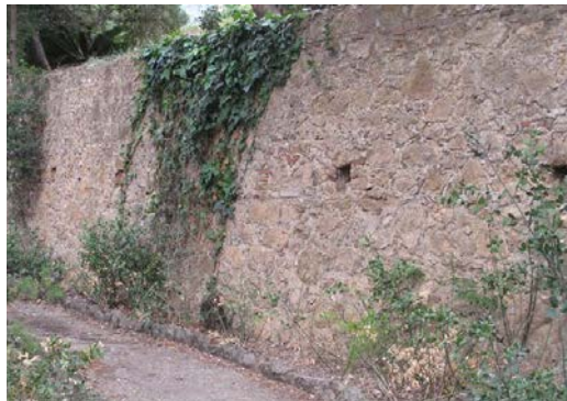
Desnivells i murs