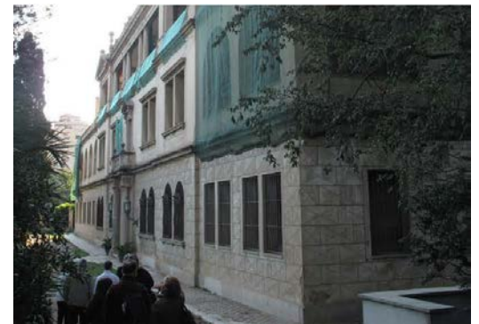
Masia rehabilitada el 2.015. Actual Museu del Moble.