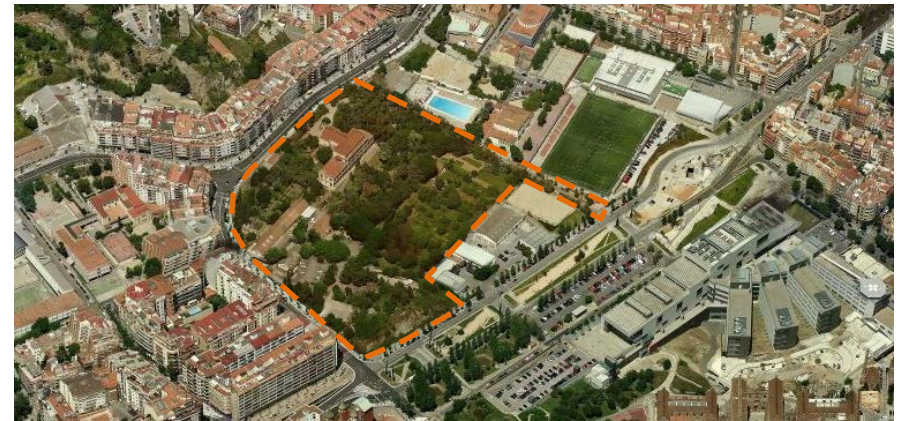
Vista orientació sud - nord