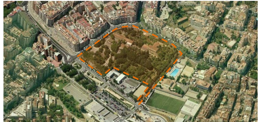
Vista orientació eix est - oest