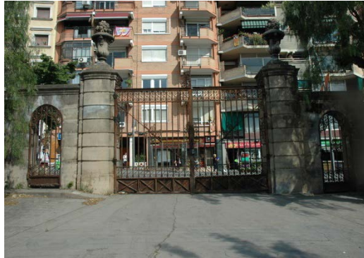
Accés al jardí des de l'Av. Mare de Déu de Montserrat