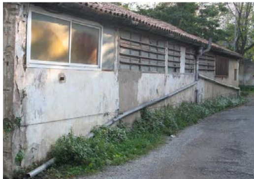
Edificacions a enderrocar