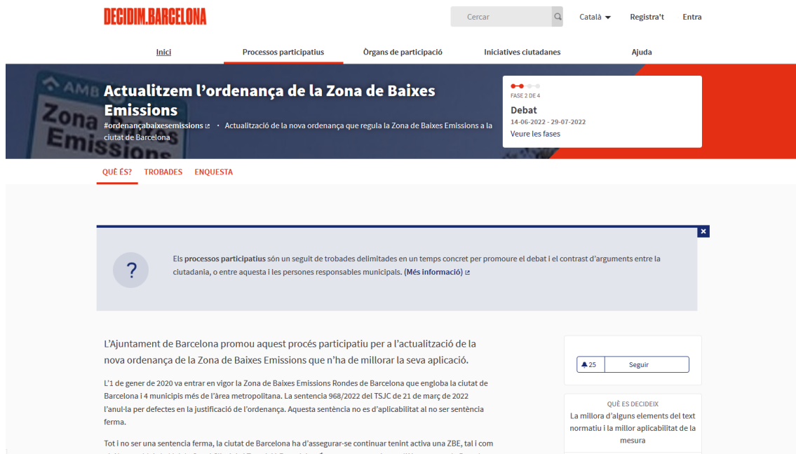
Imatge de la portada de l'espai específic del procés a la plataforma decidim

Per facilitar el seguiment del procés i la seva traçabilitat s'ha habilitat un espai específic per aquest procés a la plataforma decidim.barcelona ( https://www.decidim.barcelona/processes/zonabaixesemissions ) creat per comunicar el procés i des d'on s'ha pogut fer el seguiment i accedir a la documentació prèvia i els informes de les sessions, consultar i fer comentaris a les propostes sorgides a les sessions, i respondre una enquesta sobre la ZBE i la seva aplicació.