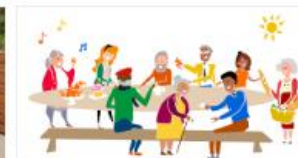
Parla en companyia: app per lluitar contra la soledat.