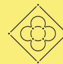
Estratègia municipal contra la soledat