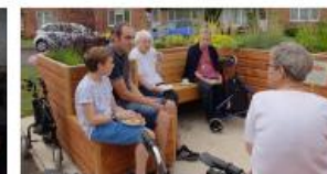
Friendly Bench: comunitats socials en un banc públic.