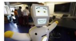
Stevie II, el robot que cuida persones grans i les acompanya en moments de soledat.