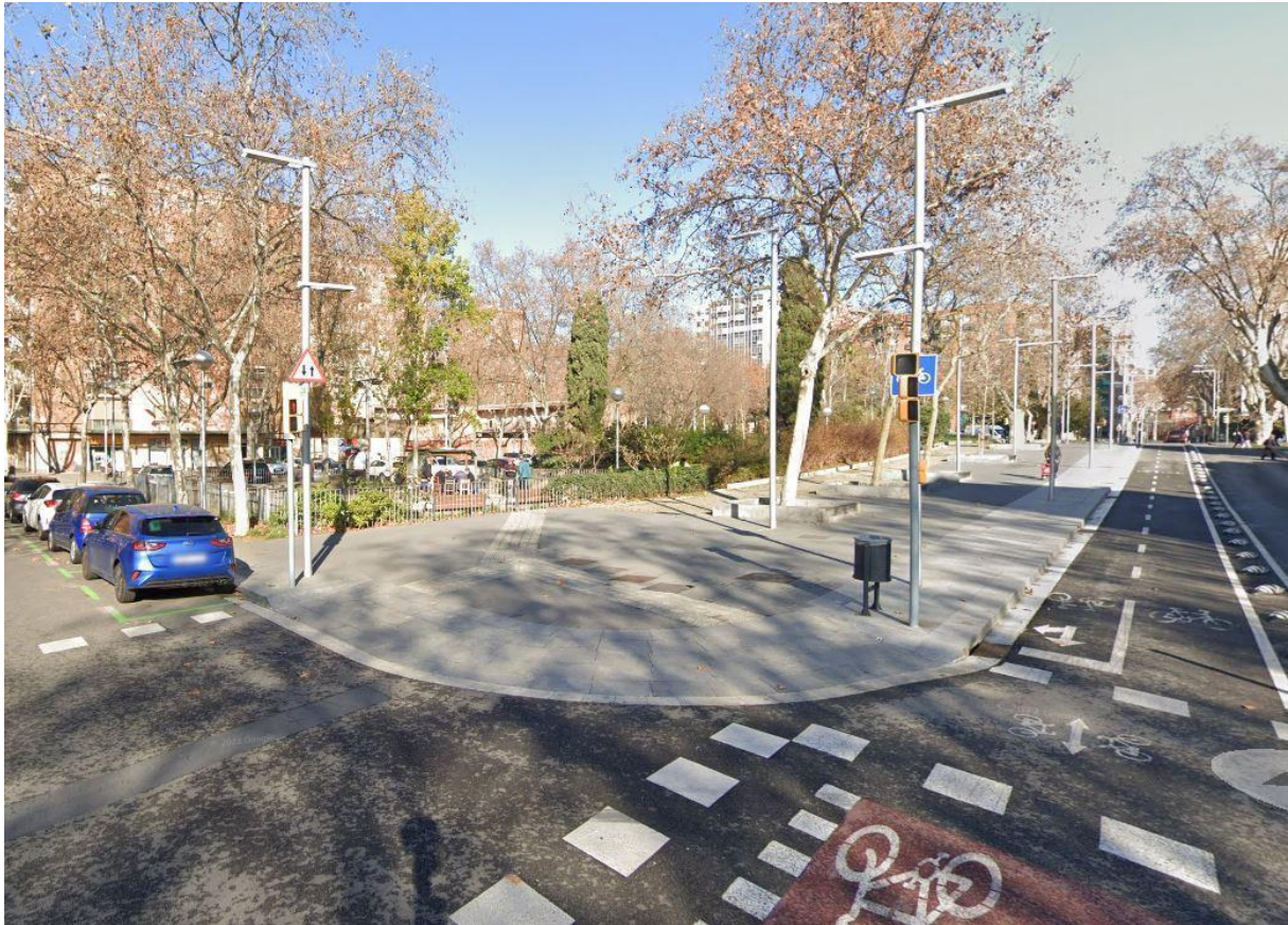
Figura 9. Primera parada al C/ Maresme amb C/ Pere IV, costat muntanya-Besòs.

Temes tractats: Convivència de mobilitats, usos, identitat i memòria.