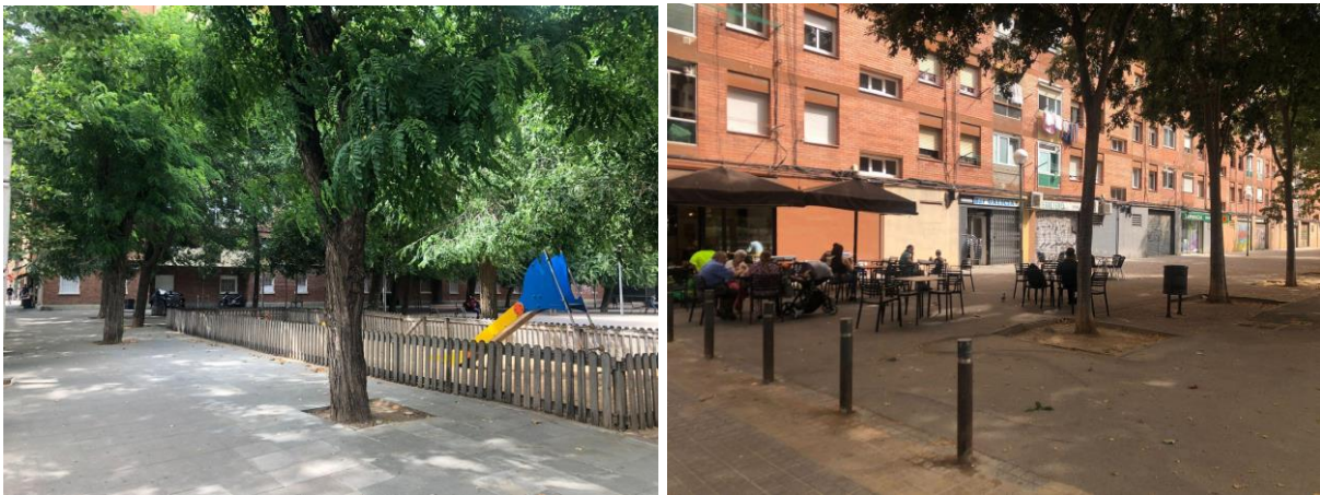
Figura 14. Sisena parada al C/ Maresme, Pl. Maresme.

Temes tractats: Usos, elements urbans i necessitats bàsiques, zones d'aparcament, percepció d'inseguretat, caràcter de l'espai, renaturalització de l'espai, manteniment i neteja, connectivitat, elements urbans i necessitats bàsiques.