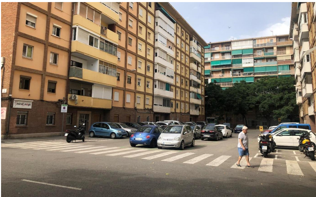
Figura 13. Cinquena parada al C/ Maresme, entre C/ Pallars i C/ Pujades.

Temes tractats: Zones d'aparcament, elements urbans i necessitats bàsiques.