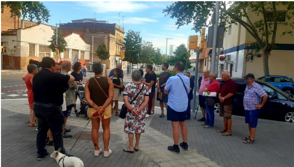
Figura 2. Veïns i veïnes participant de la marxa exploratòria.