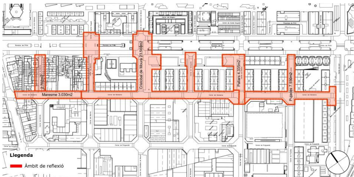
Figura 1. Àmbit de reflexió.

L'àmbit de reflexió del nou eix verd de carrer Maresme i entorns, abasta una superfície de 41,560 m 2 i comprés els següents trams de carrers: C/ Maresme entre -C/ Pere IV i C/ Llull-, C/ Bolívia, C/ Marroc, C/ Cristóbal de Moura, C/ Veneçuela, C/ Pallars i C/ Pujades, entre Rbla. Prim i C/ Maresme.