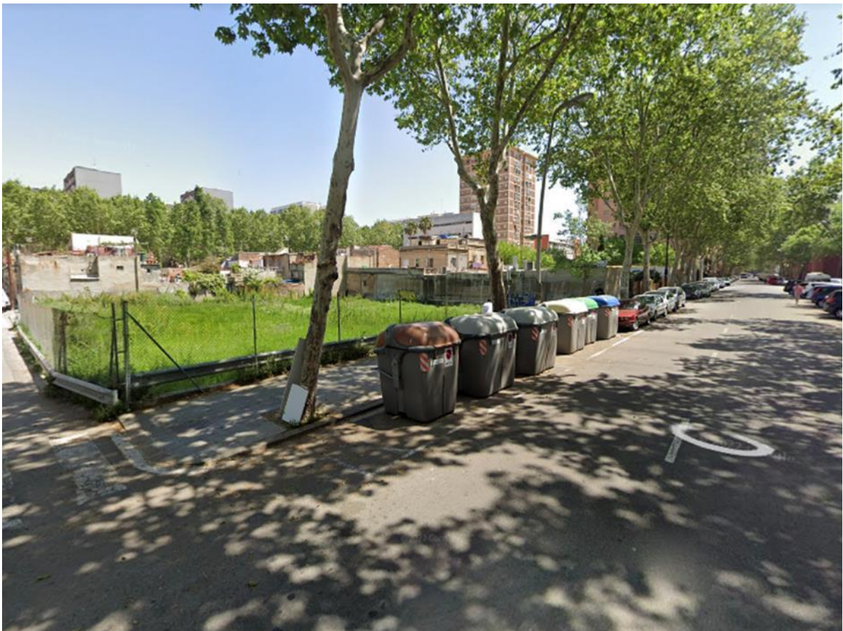
Figura 5. Primera parada al C/ Maresme, entre C/ Bolívia i C/ Marroc.

Temes tractats: Usos, percepció d'inseguretat, accessibilitat, manteniment i neteja, connectivitat, identitat i memòria, participació, altres: equipaments.