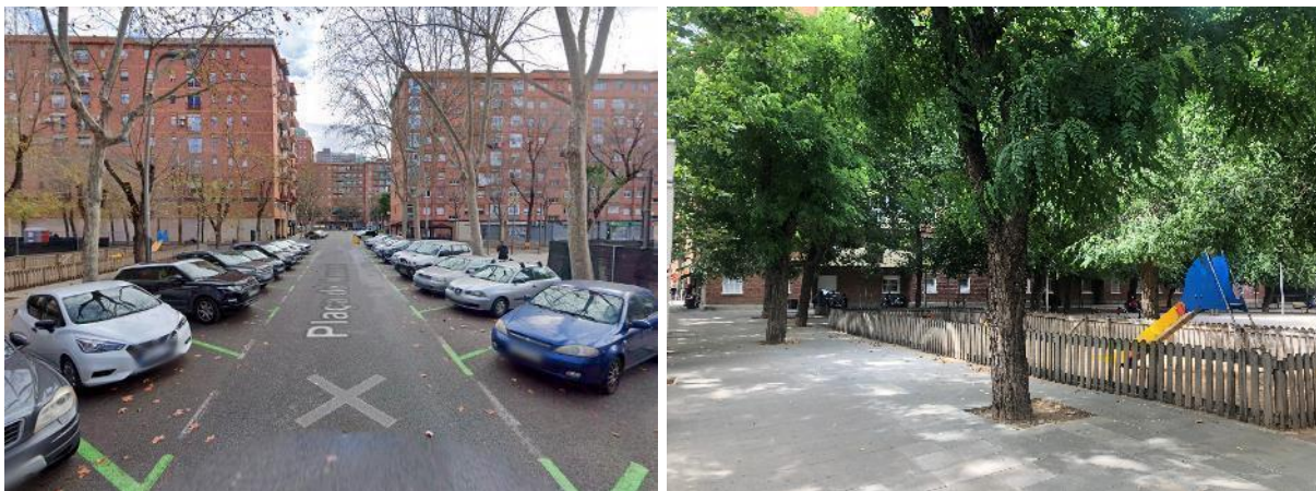
Figura 8. Quarta parada al C/ Maresme, Pl. Maresme.

Temes tractats: Usos, espais d'estada i trobada, caràcter de l'espai, participació, convivència a l'espai públic, zones d'aparcament.