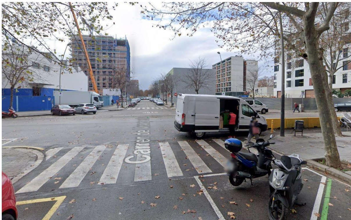
Figura 12. Quarta parada al C/ Maresme, encreuament amb C/ Veneçuela.

Temes tractats: Connectivitat, usos, percepció d'inseguretat.