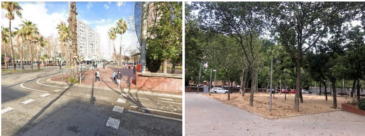
Figura 7. Tercera parada al C/ Cristóbal de Moura, entre Rbla. Prim i C/ Maresme.

Temes tractats: Usos, convivència a l'espai públic, espais d'estada i trobada, elements urbans i necessitats bàsiques, connectivitat i impacte econòmic i social.