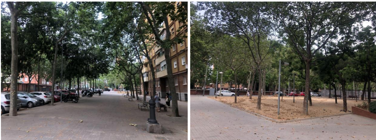
Figura 11. Tercera parada al C/ Cristóbal de Moura, entre Rbla. Prim i C/ Maresme.

Temes tractats: Usos, manteniment i neteja, elements urbans i necessitats bàsiques, caràcter de l'espai, connectivitat, percepció d'inseguretat.