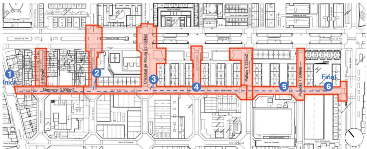
Figura 4. Plànol del recorregut blau.