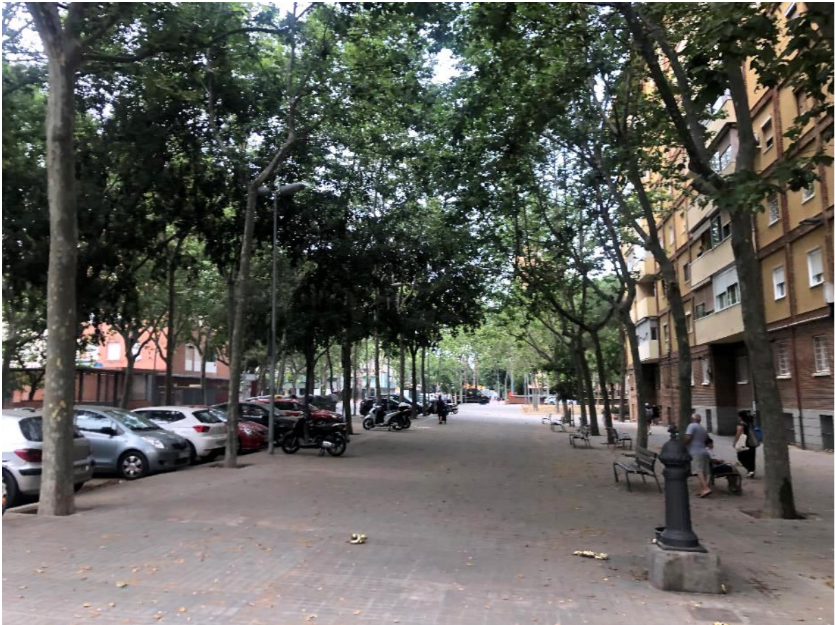
Figura 6. Segona parada al C/ Maresme, entre C/ Marroc i C/ Veneçuela.

Temes tractats: Espais d'estada i trobada, convivència a l'espai públic, identitat i memòria, zones d'aparcament, participació, manteniment i neteja, connectivitat.