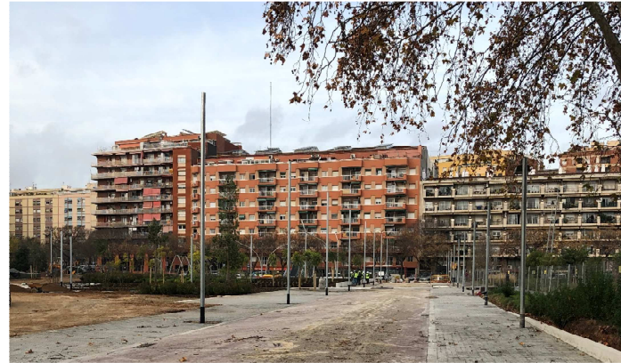
Vial peatonal i de serveis de connexió entre Gran de Sant Andreu i Torres i Bages