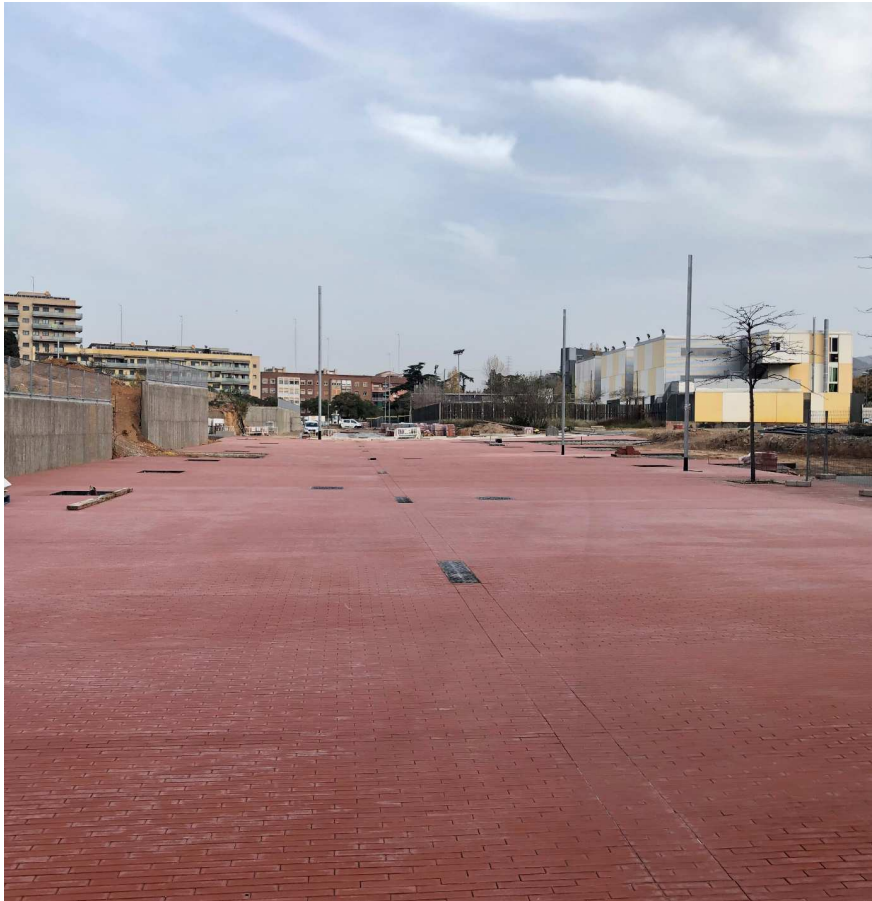
Vista estat actual rambla