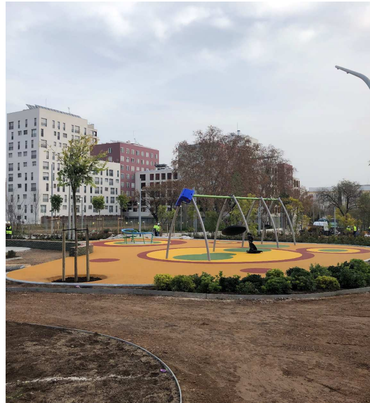
Jocs infantils / integració /totes les edats