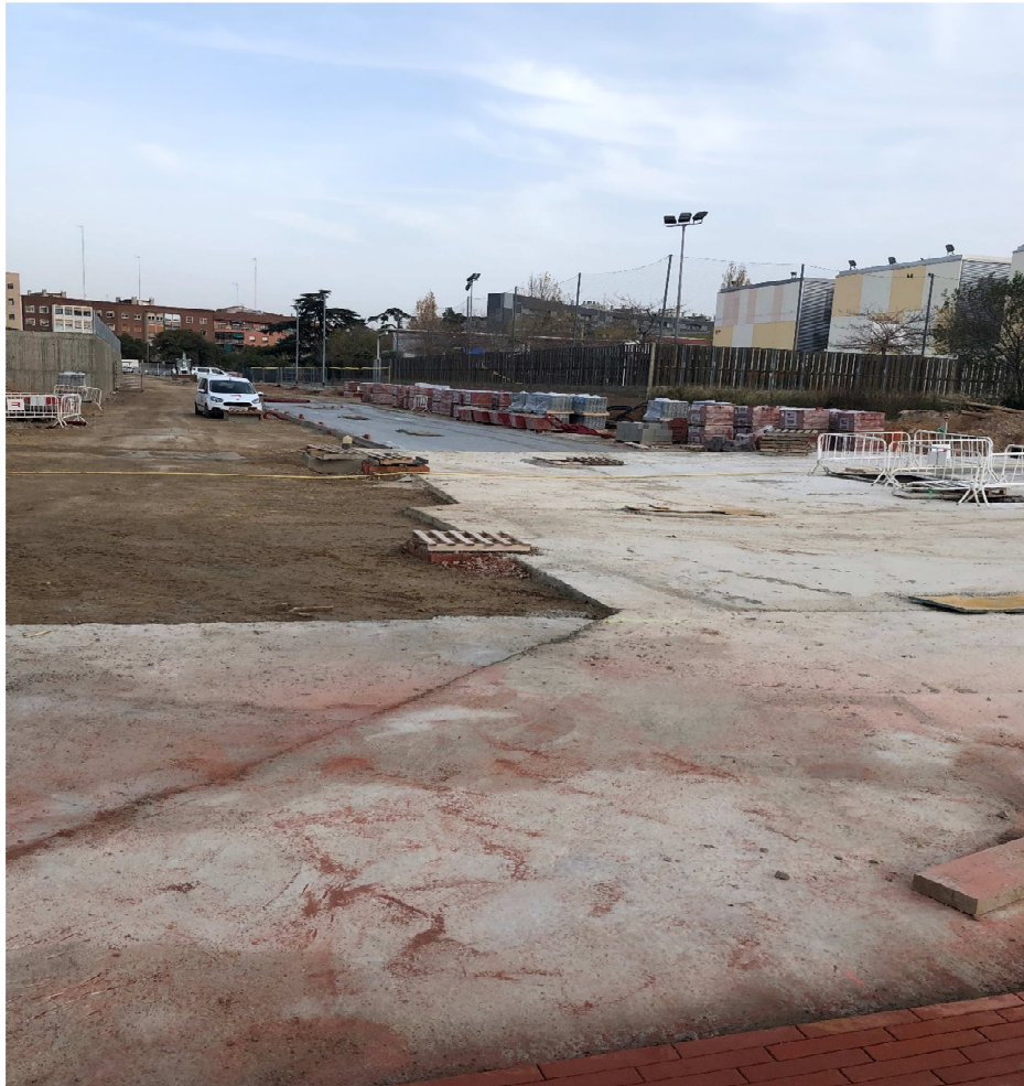
Estat d'obres de la Rambla al seu pas pel Col·legi i entrada provisional