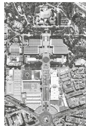
DE RECINTE A CIUTAT