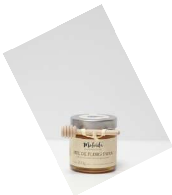
Miel pura 150g. Proyecto: BOSCAT