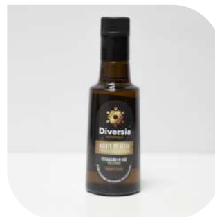
Aceite de oliva virgen extra ecológico. Proyecto: Asociación Amica