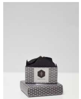
Jabón de ceniza exfoliante. Proyecto: Ashes to life