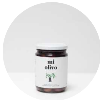
Aceitunas de mesa variedad empeltre. Proyecto: Apadrina un olivo