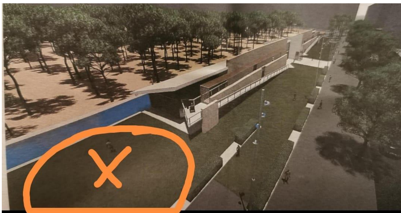
Imatge on s'observa la part on proposem ubicar-hi la instal·lació d'elements lúdics i esportius