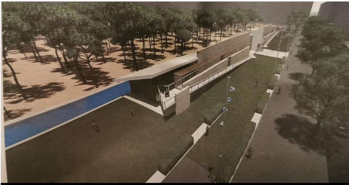
Imatge que va presentar el Districte de l'Eixample a la trobada que es va realitzar al Parc Joan Miró

El passat dia 20 d'abril ens vam trobar famílies, centres educatius i equipaments pròxims al Parc Joan Miró, molts d'ells pertanyents al projecte del Camí Amic, per parlar i proposar canvis sobre la situació del Parc en general i dels entorns de la Biblioteca Joan Miró en particular. Aquesta trobada es va generar després de la trobada que va promoure el Districte de l'Eixample amb veïnat, equipaments, serveis municipals i entitats.