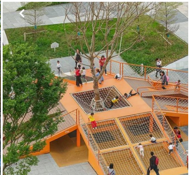
Propostes per a la Zona Infantil (elements lúdics, de lleure i esport)