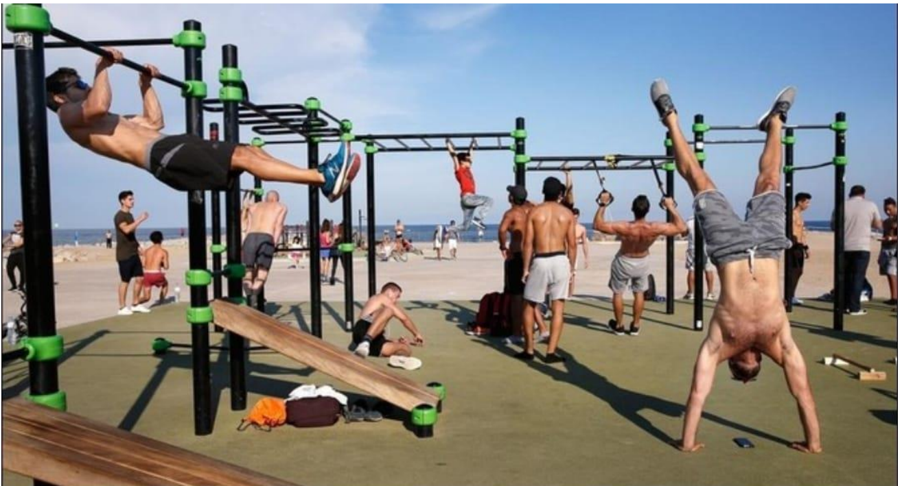
Propostes per a la Zona d'Esport