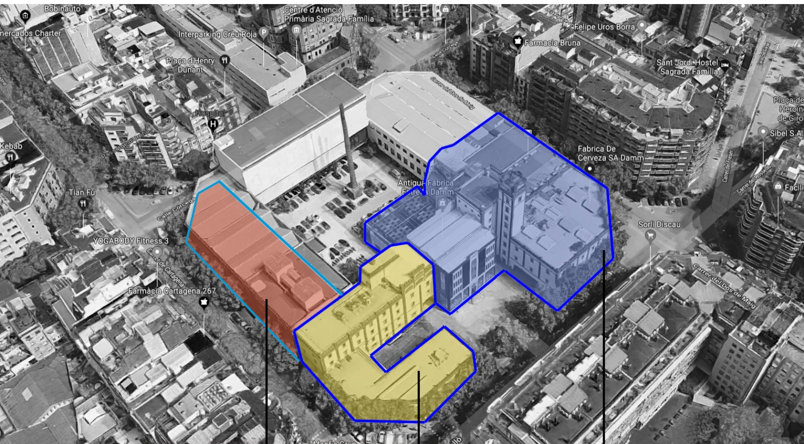
EQ. PUBLIC 2