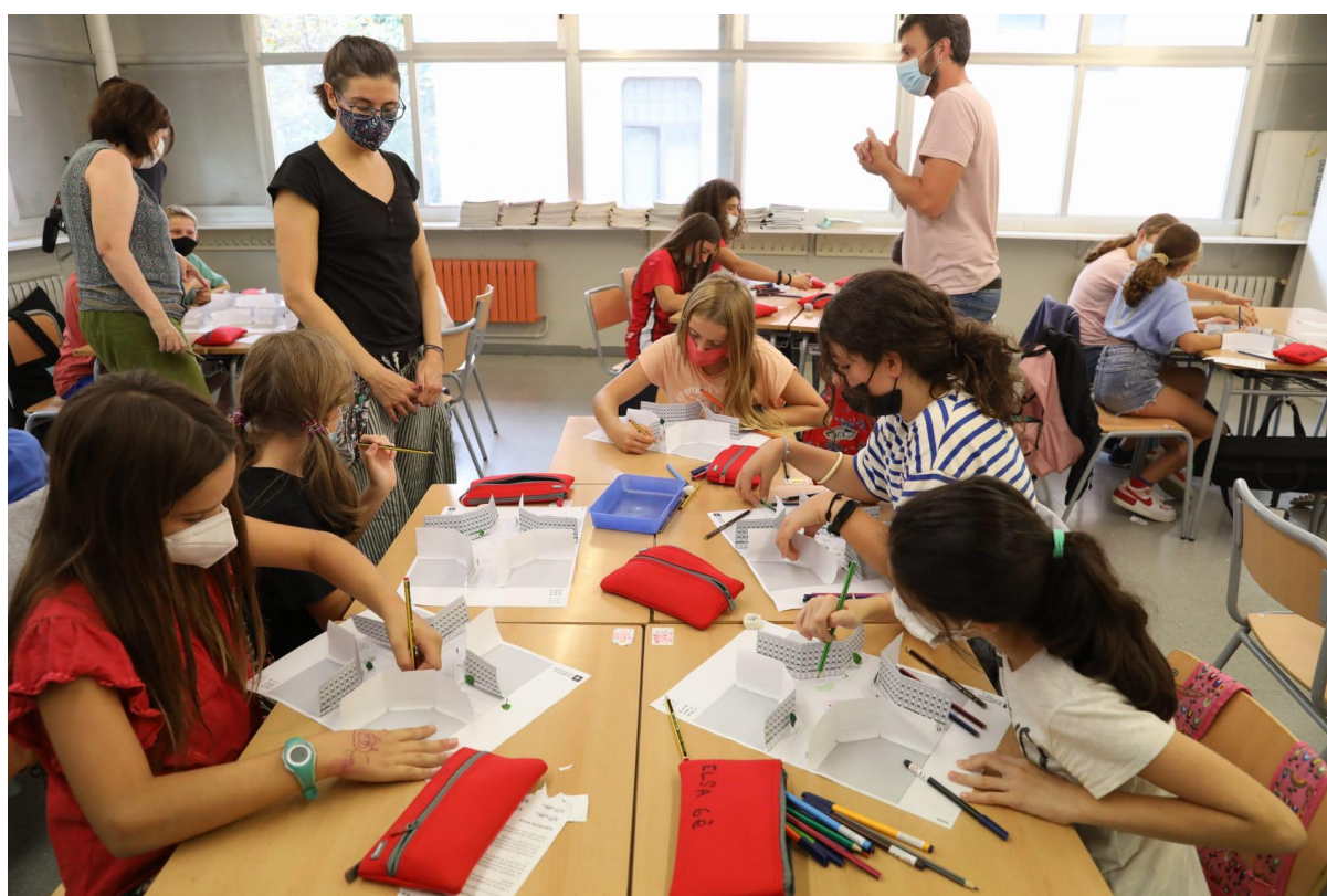
Imatges de la dinamització realitzada amb els participants al Centre Educatiu.