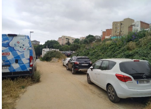
Camí de Sant Genís a Horta, 2-24 (Fotos 1, 2 i 3)