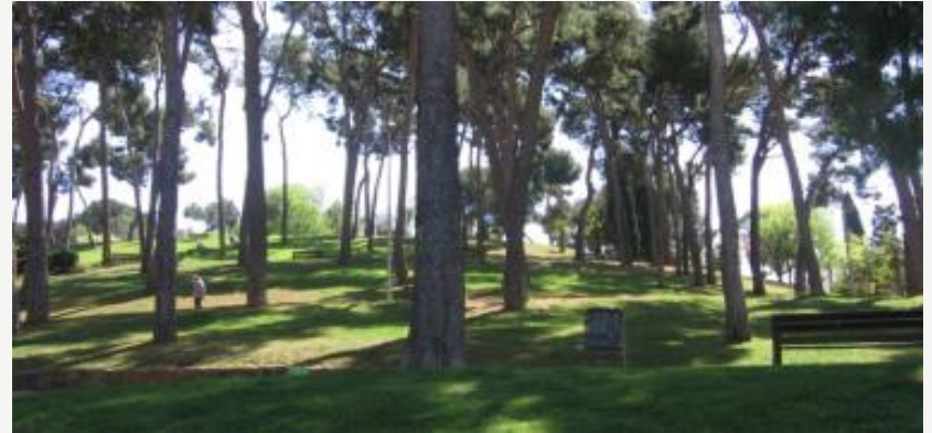
Parc del Turó de la Peira