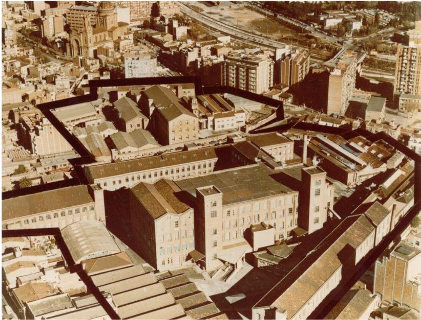
Vista aèria de les instal·lacions de Sant Andreu de la Fabra i Coats