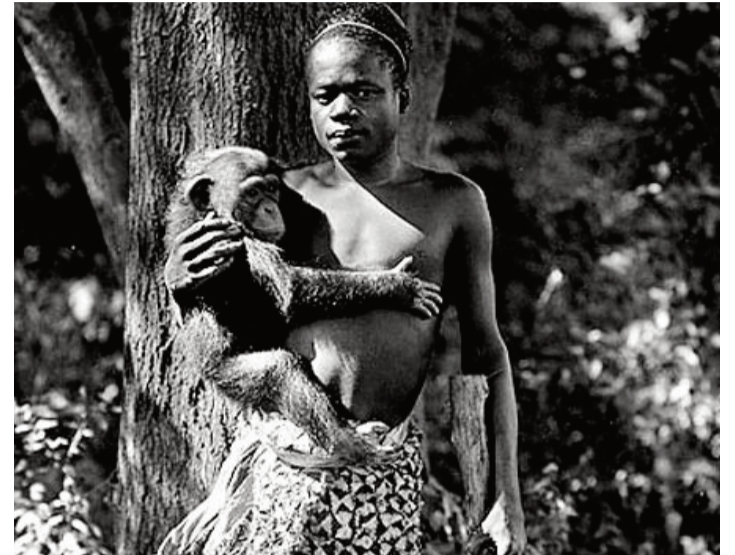
Ota Benga al Bronx Zoo, 1906

Primer es va intentar repatriar a Benga a la seva terra, sense èxit. Més tard, inserir-lo dins la societat americana. Es va trobar presoner entre dos mons, sense poder tornar a l'Àfrica i vist principalment com una curiositat als Estats Units. Finalment, aquest intent d'integració va desembocar, als seus 32 anys d'edat, immers ja en una profunda depressió, en el seu suïcidi.