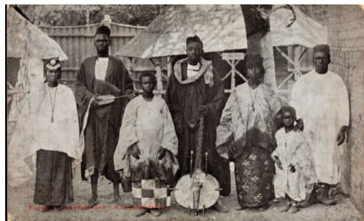
Africans a l'exposició "Vila Congo", 1914

Amb motiu del primer centenari constitucional, un poble exposició conegut com "Kongolandsbyen" (o "Vila Congo") va ser exhibit al 1914 durant cinc mesos. El propi rei de Noruega va oficiar la inauguració. Hi visqueren 80 persones d'origen africà, la majoria de Senegal, i reproduïen usos i costums africans.