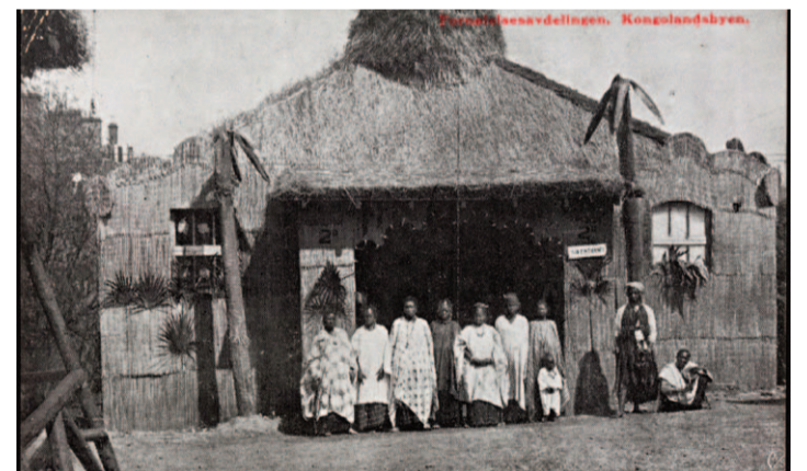
Exposició "Vila Congo", 1914

Avui en dia, existeix una controvèrsia en referència a una exposició actual a Oslo, que intenta reproduir l'original exposició del 1914. Es tracta d'una mostra