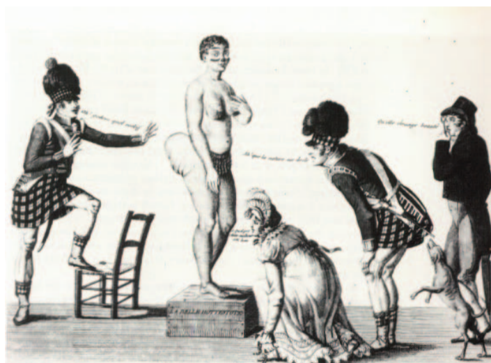
Hottentot Venus, segle XIX (Autor desconegut)

Saartjie Baartman va néixer el 1789 a Sud-Àfrica. Originària del poble khoikhoi, conegut com hotentot (terme usat despectivament, que significa tartamut en holandès), va ser portada a Londres l'any 1810, als 21 anys d'edat.