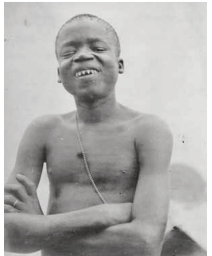
Ota Benga, 1904

Madison Grant, un científic racista i eugenista, conjuntament amb el conservacionista i director del mateix zoològic, William Hornaday, van planejar una forma de promocionar el "racisme científic". Decidiren exposar a Ota Benga conjuntament amb un orangutan, formant part de la "Casa dels Micos". Benga va fer-se famós com "La Baula Perduda", concepte pel qual volia fer-se entendre que l'africà s'ubicava en una posició a camí entre el mico i l'home.