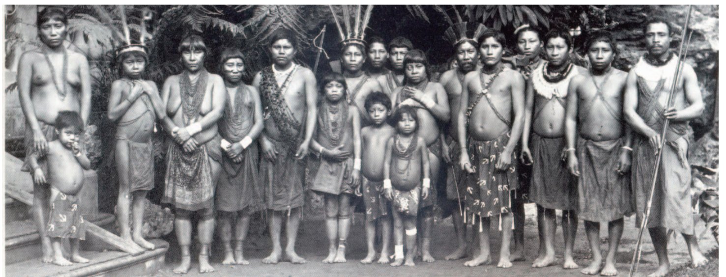
Indígenes Kalina, París, 1892 (Autor: Prince Roland Bonaparte)

Van ser molts els casos de nadius expatriats a la força durant les últimes dècades del segle XIX, i primeres del segle XX, amb la finalitat de ser exhibits al món occidental. Però de tots aquests, ens ha arribat un llegat de dos casos que han estat documentats a partir de dos àlbums de fotografies del príncep Roland-Napoleon Bonaparte i que es troben a la "Bibliothèque Nationale Française", a París. En aquests llibres es troben, com a mostraris humans, diverses fotografies de nadius xilens forçats a fer gira euro-